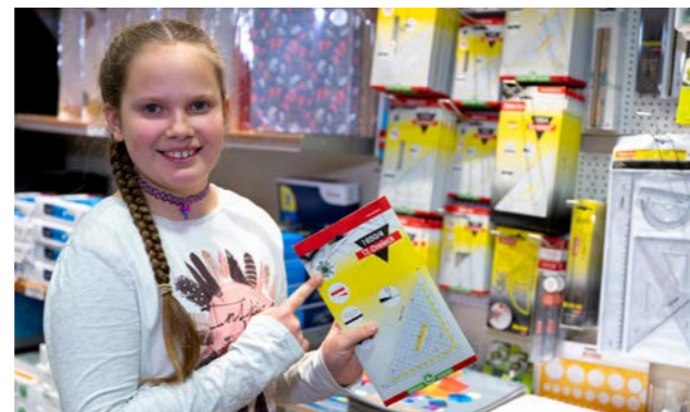
Mädchen mit Geodreieck, Bild: BMK/Viktoria Miess