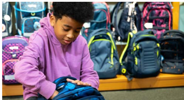
Junge mit Schulrucksack

Besuchen Sie auch: bueroeinkauf.at und umweltzeichen.at