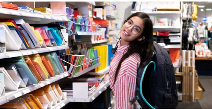
Mädchen mit Schulrucksack