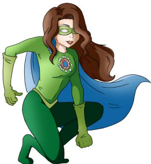
Bilderrätsel Comic-Heldin